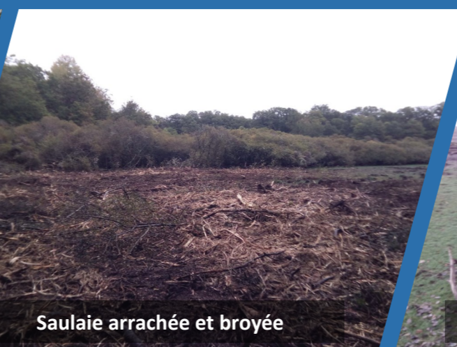
Saulaie arrachée et broyée