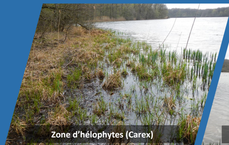
Zone d'hélophytes (Carex)