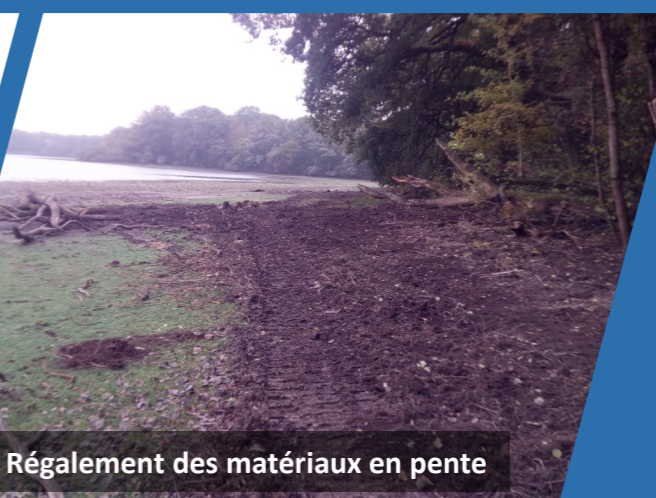
Régagement des matériaux en pente