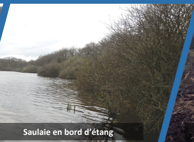
Saulaie en bord d'étang